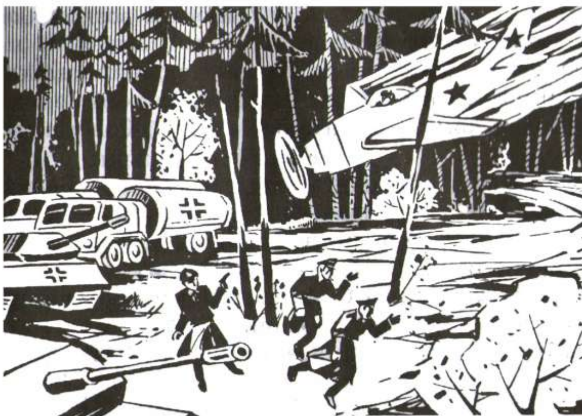
Подвиг Исмаилбека Таранчиева.